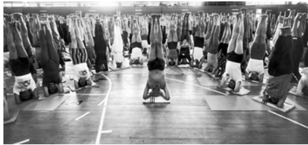
Indiase yogagoeroe B.K.S. Iyengar tijdens Iyengar Yoga Convention, Londen, 1993.

Beelden zijn beschikbaar in 300 dpi, .jpg bestand en 72 dpi, .png bestand.