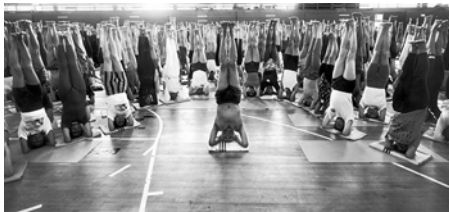
Indian yoga guru B.K.S. Iyengar during the Iyengar Yoga Convention, London, 1993.

Images are available in 300 dpi, .jpg file and 72 dpi, .png file