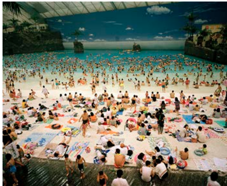
Ocean Dome, Miyazaki, Japan, 1996.